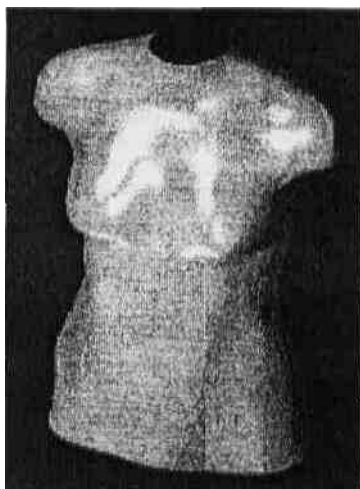
Рисунок 1: Компьютерный манекен.

кривизн - гауссова кривизна - остается неизменной, и это фундаментальное положение внутренней геометрии поверхностей. Следовательно, если поверхность путем